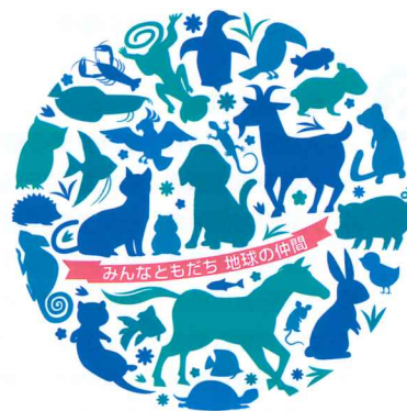
みんなともだち 地球の仲間